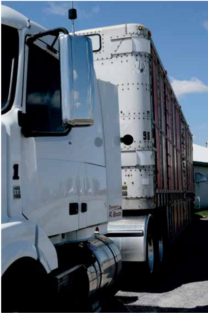
Au chapitre de la mise à jeun, 98 % des lots de porcs livrés sont conformes. Une bonne mise à jeun diminuerait par ailleurs de moitié le risque de mortalité durant le transport.