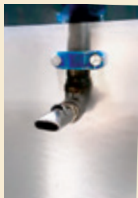
La suce « bite ball »