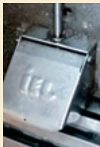
Le bol à eau conventionnel muni d'un couvercle