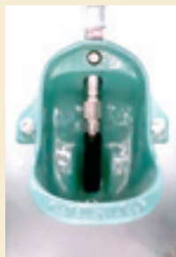
Le bol Suevia

Pour mener à bien l'évaluation, le CDPQ a créé un système permettant de quantifier l'utilisation et le gaspillage de l'eau. Celui-ci mesure la quantité d'eau distribuée aux porcs dans un parc à l'aide d'un compteur d'eau relié à un système d'acquisition de mesures. Un réservoir est installé sous les systèmes d'abreuvement afin de récupérer et mesurer l'eau gaspillée par les porcs (Figure 2 à la page 62).