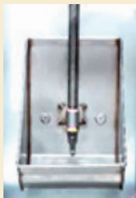
Le bol à eau conventionnel