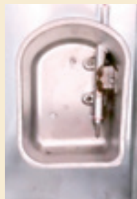
Le bol urinoir