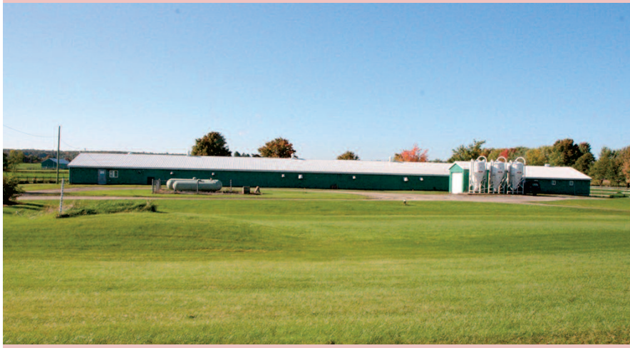
La Station d'évaluation des porcs de Deschambault, construite en 1994.