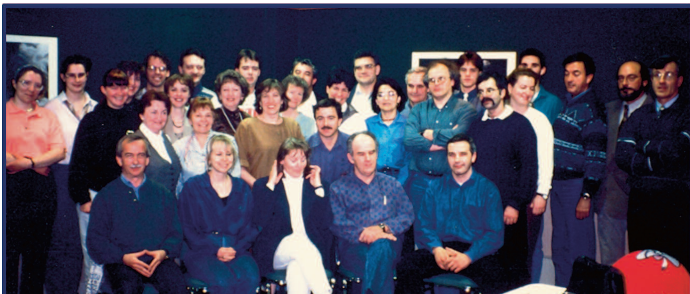
L'équipe du CDPQ à ses débuts.

Cette année, le Centre de développement du porc du Québec (CDPQ) célèbre son 30 e anniversaire. Trente ans, c'est trois décennies de passion d'expertise, et surtout, de grands accomplissements. Cap sur un organisme qui a su faire preuve d'adaptation avec les années et qui entame sa quatrième décennie avec une panoplie de projets stimulants.