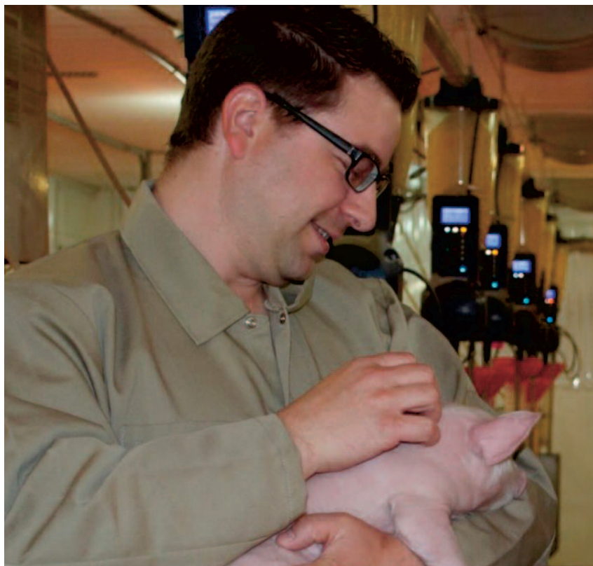
Plus de 236 projets ont été effectués par le CDPQ à ce jour.

Le CDPQ s'est positionné en tant que référence dans le domaine de la recherche et du développement, tant au niveau provincial que pancanadien. D'ailleurs, après la tenue du Forum sur la recherche, le développement et le transfert technologique (RDT), il y a 5 ans, la filière a mandaté le CDPQ pour mettre en place un comité pour répondre aux besoins de la filière porcine québécoise, nommé le Comité RDT. Regroupant des intervenants de tous les maillons de la filière, ce comité a comme objectif d'assurer une meilleure synergie du travail des intervenants impliqués dans la recherche publique et privée, et contribuer ainsi à une meilleure complémentarité des actions. À ce jour, c'est plus de 236 projets de recherche et 38 épreuves qui ont été effectués par le CDPQ. Près de 150 plans de fermes ont également été réalisés jusqu'à maintenant (Service d'accompagnement vers les truies en groupe) de même que plusieurs projets de recherche sur les truies en groupe.